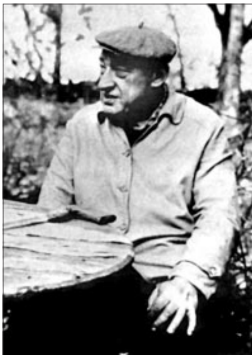
Štěpán Kardinál Trochta

dokázali neodhodit. Došel k svému cíli. Vydal svědectví, co lze unést a ukázal směr cesty. Je to snad málo?